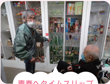
青春へタイムスリップ

コロナ禍で行動制限をしておりますが、制限の解除にあたり名古屋市昭和日常博物館の見学に行きました。利用者様の子どもの頃や青春時代に使われていた生活用品などをご覧になり、見学に参加された利用者様同士で話に華を咲かしたり、職員に「これは、こう使ってたんだよ」とわかりやすく説明されたり、懐かしい記憶が蘇ったりするなど、とてもいきいきとされています。