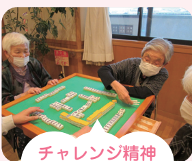
チャレンジ精神全開!?

利用者様から「麻雀をみんなでやりたい」と声がかかり、トランプなど馴染みのある遊びだけでなく、新たに麻雀をクラブ活動として取り入れました。初心者の方には、経験のある利用者から教えてもらうことで、双方の脳が活性化するため、楽しく認知症予防につながっています。