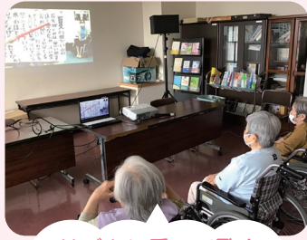
リズムに乗って歌を唄いました！

利用者の皆様が楽しみにされている名古屋芸術大学の学生との音楽交流は、現在、オンラインで行っています。講師の合図で大画面に歌詞や叙情的な映像が映し出され、音楽に合わせてリズムをとり、歌を唄ったり楽器でメロディーを奏でたりします。音楽と触れ合うと皆様柔らかな表情になり、昔を懐かしむ会話が聞かれます。生理的・心理的・社会的な効果が期待できる音楽交流を、これからも継続したいと思います。