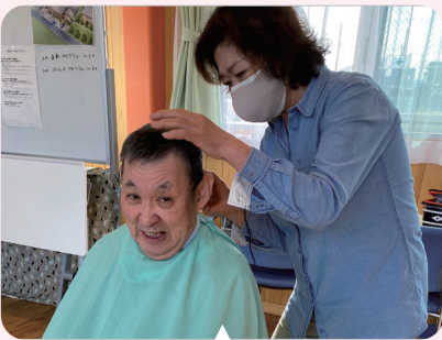
爽やかさを目指しカット中