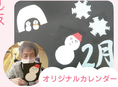
オリジナルカレンダー