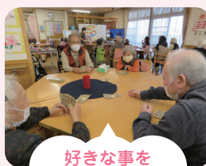
好きな事を選んで楽しむ!!

選択レクリエーションは利用者様から好評をいただいています。特に好評なのが、「つぼふり」です。カジノを真似て、金銭感覚や壺振などは、手先や頭の回転が鍵となります。運任せの頭脳戦を明るく楽しめる内容で、心身や頭のエクササイズを行っています。楽しさ溢れるレクリエーションを提供し、生活の質が上がるよう支援させていただきます。