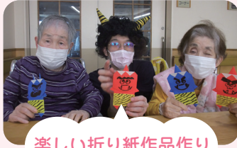
楽しい折り紙作品作り

日々、季節の風物詩の作品作りや季節感を感じさせるレクリエーションを企画しています。その中でも人気があるメニューは、頭と指先の機能訓練にも効果的な折り紙作品作りです。作品は季節の風物詩や催しに合わせたお題とし、利用者様と職員と一緒に作る時間は、充実したひと時となります。1月はお正月、2月は節分、3月はひな祭りなど、季節感を大切にすることに、利用者様の生活の質を高められるよう努めていきます。