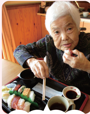
お寿司パーティー開催

各々が好きなネタを注文し、楽しんでいただきました。利用者様の何気ない呟きから、思い出に残る一日となりました。