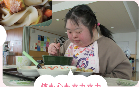
体も心もホカホカ