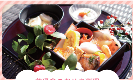
普通食のおせち料理

食材をペースト状にして特殊ゲル化剤を加えて成型していますので従来のミキサー食とは違い、食材本来の味がします。味だけではなく食事を目で見たくために成形にもこだわっています。