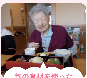
旬の食材を使った松花堂弁当

食事の行事を定期的に行っております。利用者様から評判の食事を是非食べに来てください。