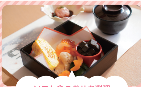
ソフト食のおせち料理

今年のおせち料理のソフト食はこのように形で提供しました。ソフト食は舌と上顎で潰せる硬さに仕上げているので、嚥下障害のある方も比較的安全に召し上がることが出来ます。