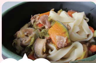
福祉の杜の ほうとう