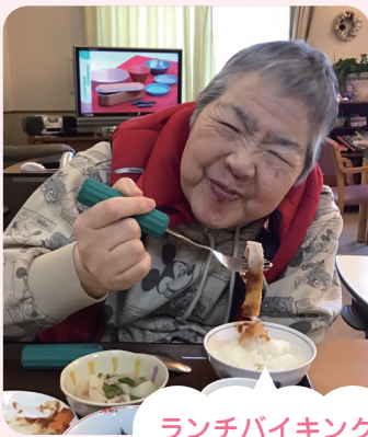
ランチバイキング

揚げたてが一番！なんだかんだで、美味しい食事は皆様を元気にする一番の薬だったりするので